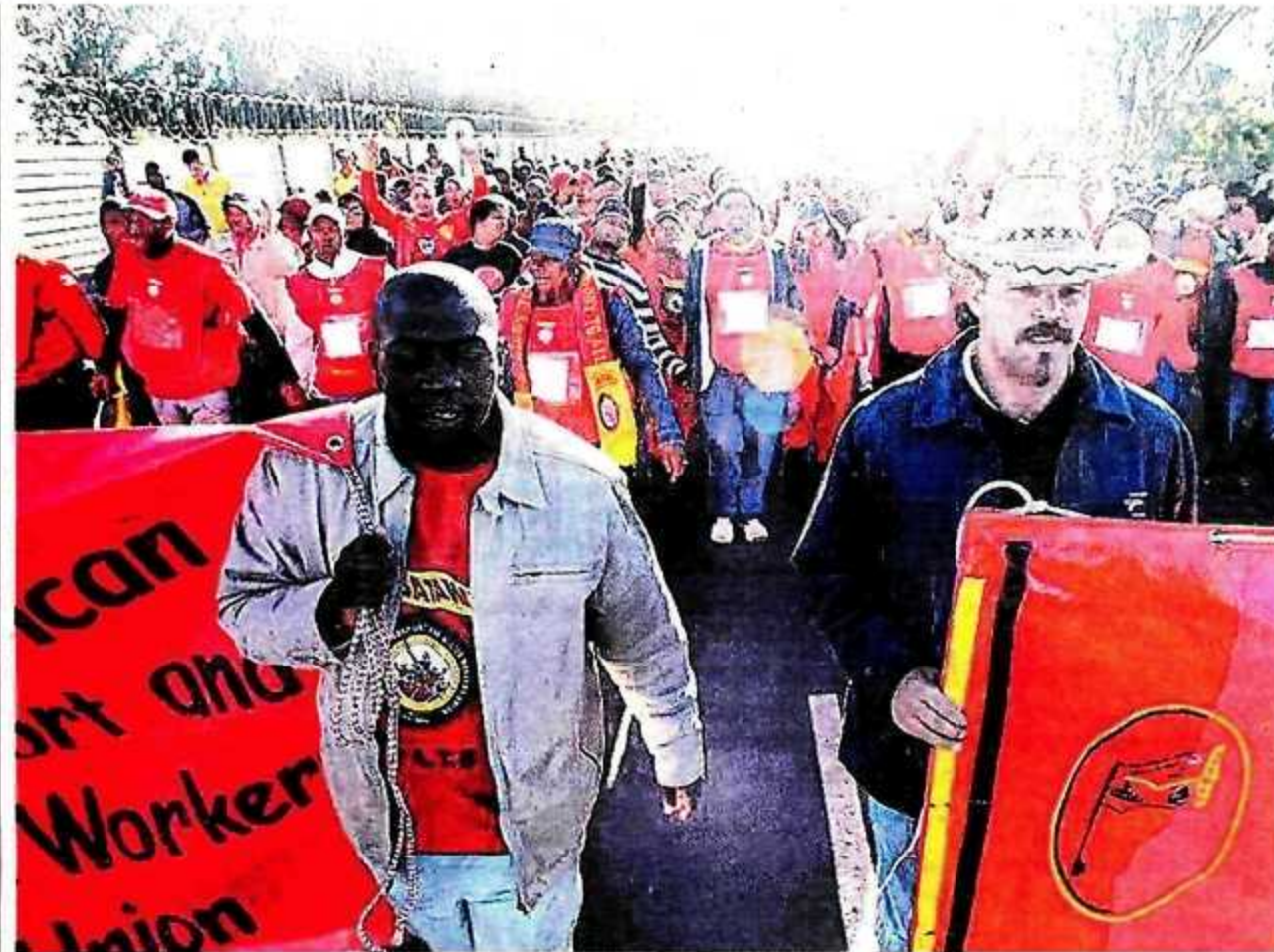
Stakende werknemers van Transnet hou 'n optog in Bloemfontein om teen die maatskappy se voorgestelde loonverhoging van 11% protes aan te teken.

"By die Suid-Afrikaanse Lugdiens en Metrorail het ons 'n paar